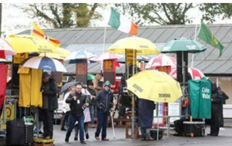
Här gäller det att hitta bookmakern med bästa oddset - och det största paraplyet...

För att åter tala om uppfödningen - klimatet, sällan riktigt kallt, sällan riktigt varmt, ofta ganska regnigt, bidrar till det gröna, friska gräset. Lägg därtill en kalk- och mineralrik jordmån med många kullar och backar för föl och unghästar att på ett tidigt stadium kunna stärka muskler, senor och ligament - och man har en viss förklaring varför det på Irland föds upp många av världens bästa hästar. Dessutom finns där en gedigen hästkunskap- och kultur sedan långt tillbaka.