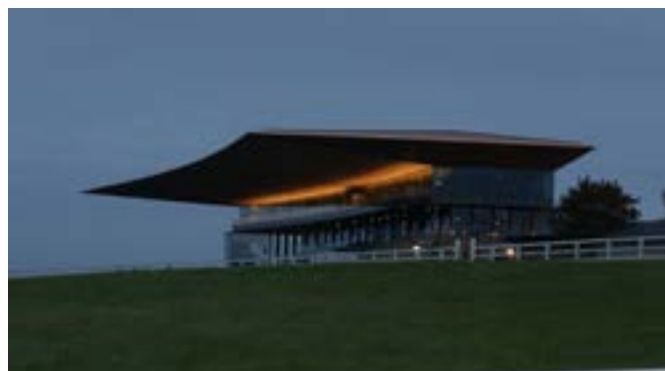
The Curragh, läktaren tidigt en lördagsmorgon.