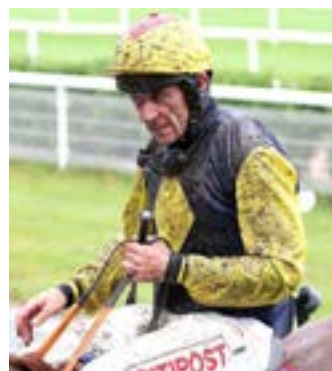
En hinderjockey, av hårt virke...

Att det krävs tuffa aktörer - hårdföra vältränade hästar och totalt orädda ryttare - för hinderloppen här, det står ganska klart.