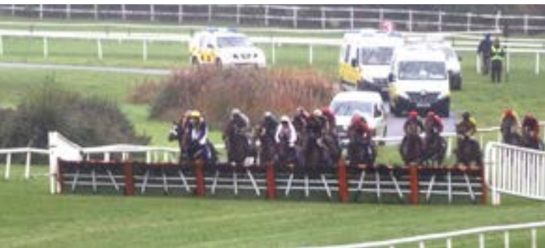
Häcklöpning på Gowran Park.

Det regnade ganska ymnigt hela dagen, och förutom nämnda huvudlöpning var det egentligen en ganska vanlig tävlingsdag på denna - med irländska mått mätt - ganska liten galoppbana. Men det kunde man knappast tro med tanke på publikuppslutningen! Här är det ett stort folk- och familjenöje att gå på galopp - regn eller inte regn - och hinderloppen står högt i kurs. Det är en del av den irländska kulturen där många har hästar och tränar på egna gårdar