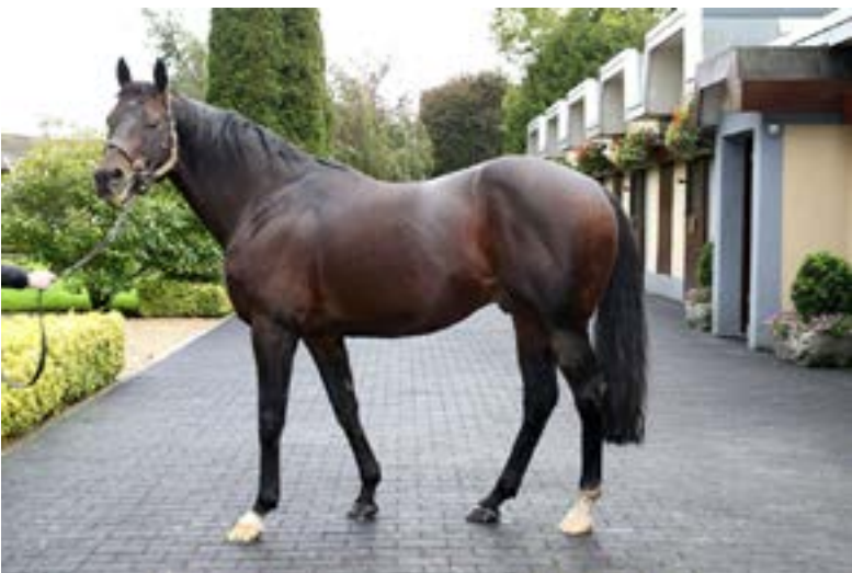
Avelshingsten Invincible Spirit på Irish National Stud.