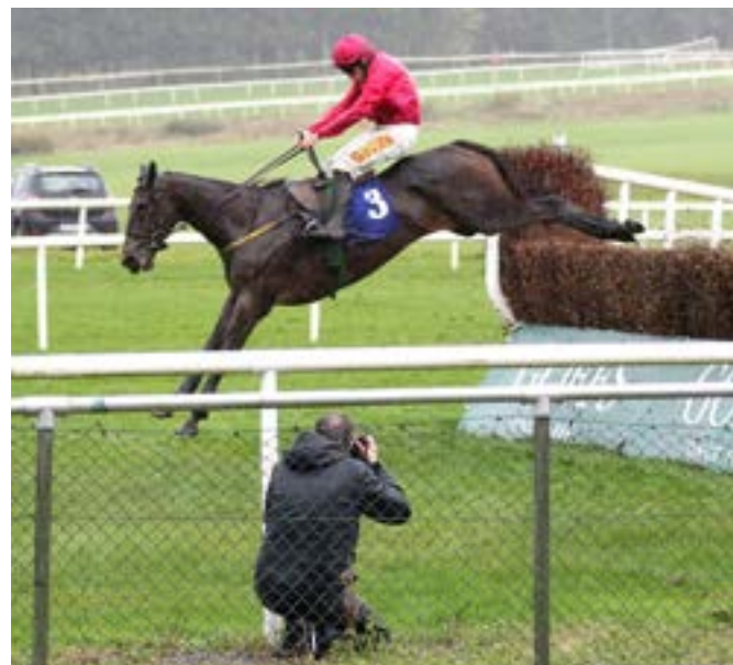
Snow Falcon - vinnaren av dagens huvudlöning - en Grade 2-steeplechase.

loppsstriderna. Det spelades en hel del. Både vid de stora spelbolagens diskar och hos de legala bookmakerna som stod utanför under stora paraplyer och visade sina senaste - och bästa - odds. Skillnaden mot för ett tiotal år sedan är att nu har de flesta en dator och internetuppkoppling också under något av paraplyerna.