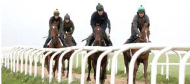
En allväders träningsbana på The Curragh.