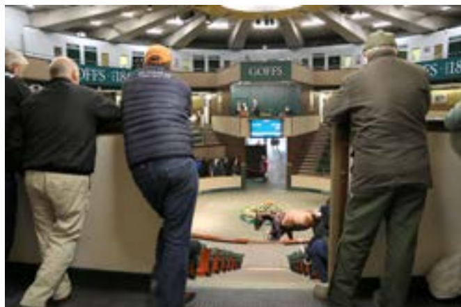
Goffs Sales auktionsring.

I övrigt var det på Goffs som på många stora auktionsföretag ute i världen - imponerande proffsigt, med tydliga budgivningningar, som visas på monitorer, välpreparerade hästar, och - höga priser.