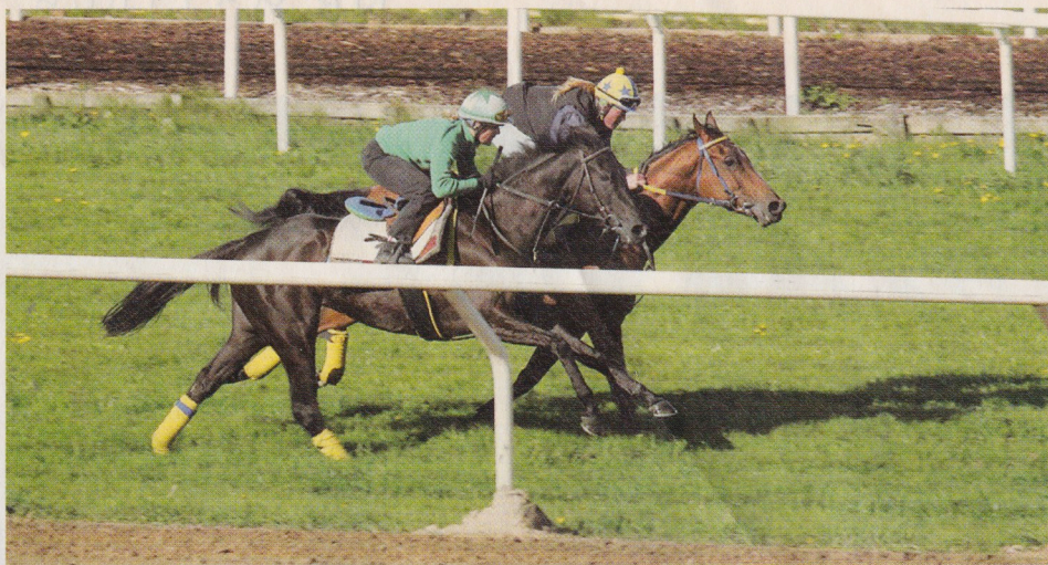
Xaara med skötaren Lotta Lie (närmast) samt Daedal och stallets förstajockey Yvonne Durant.