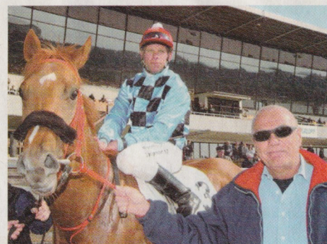
En av Ulf Ståhls absoluta favoriter i stallet - Cavorting.