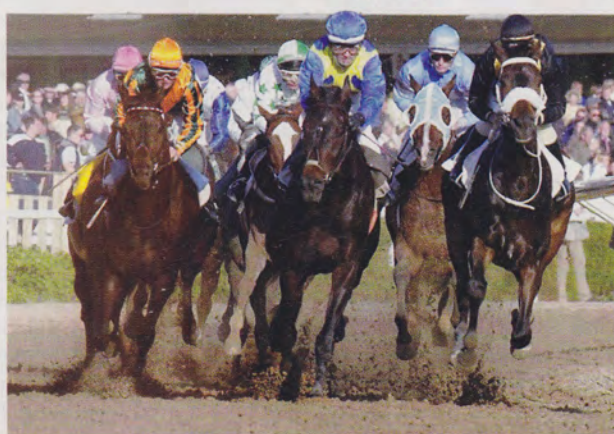
Galopploppen avgörs inte bara på banan. Ibland måste skiljedomstolen avgöra vem som vinner.