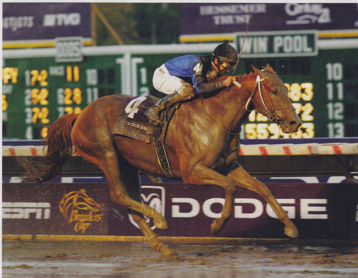
2007 års upplaga av Breeders Cup i New Jersey var allt annat än glamorös. Men Curlins seger har tvättat bort leran ur många minne.

efter varje träningspass om morgnarna tittar han efter Pancho och stannar självmant upp där han står och väntar. Och Pancho tycks veta exakt när det är dags att gå fram och möta honom.