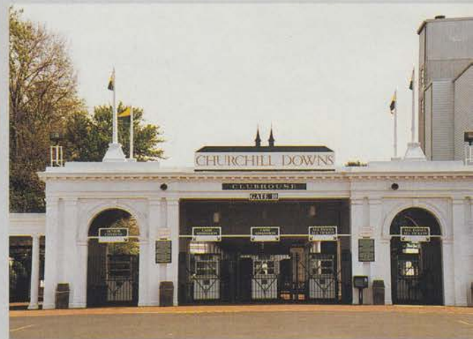
Entrén till Derby-banan i Kentucky, USA; Churchill Downs.