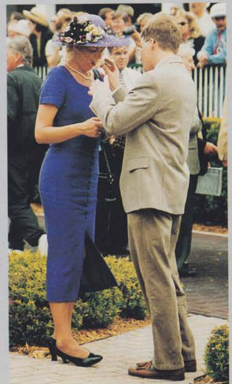
Vackra klänningar och hattar fanns det många.

Oddset var cirka fyra gånger pengarna och en och annan knuffade sig fram till luck-