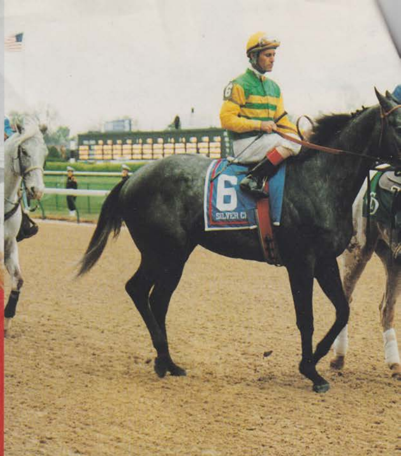
Silver Charm med Gary Stevens segrade i det 123:e Kentucky Derby, 1997.