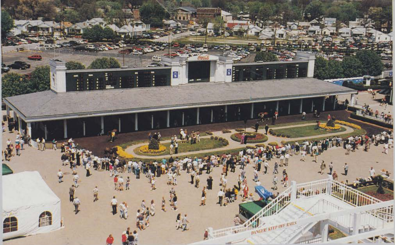
Utsikt över ledvolten innan de stora publikskarorna har anlänt.