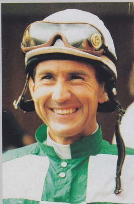
Jerry Bailey, fjolårets segerjockey i Kentucky Derby. Även känd som ständig partner till superhästen Cigar, som vann 16 raka segrar.

den senaste Grindstone. En staty över Aristides finns och intill ligger sevärda Kentucky Derby Museum där alla tiders Derbyvinnare visas och mycket mer. Toppjockeyn Jerry Bailey, den ständigt leende och sympatiska, sa själv: "Jag blir röd till tårar varje gång jag går in där!"