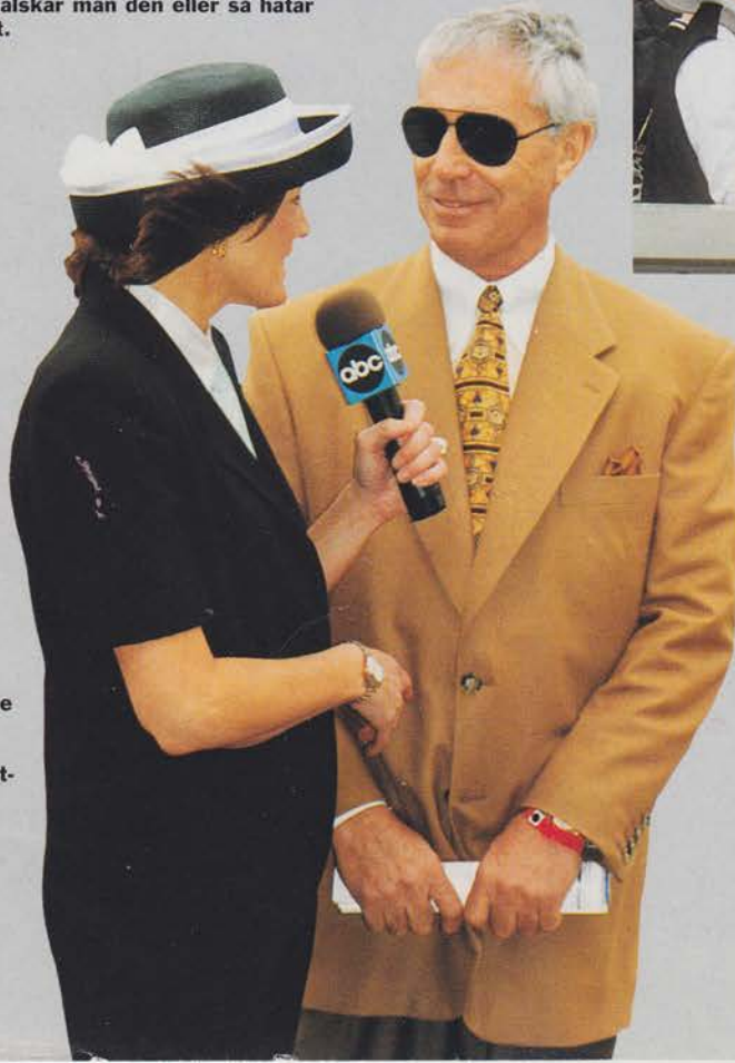
Förra årets vinnare på tränarsidan, Wayne Lukas, intervjuas av sportkanalen ABC angående årets adept, Deeds not Words.