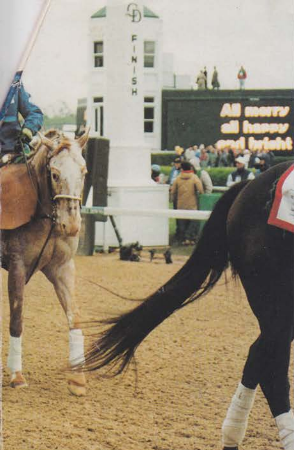
Fin hatt på ung galoppentusiast i Derbyviolet.