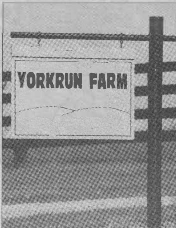
Infarten till Yorkrun Farm, svenskt stuteri i Kentucky.