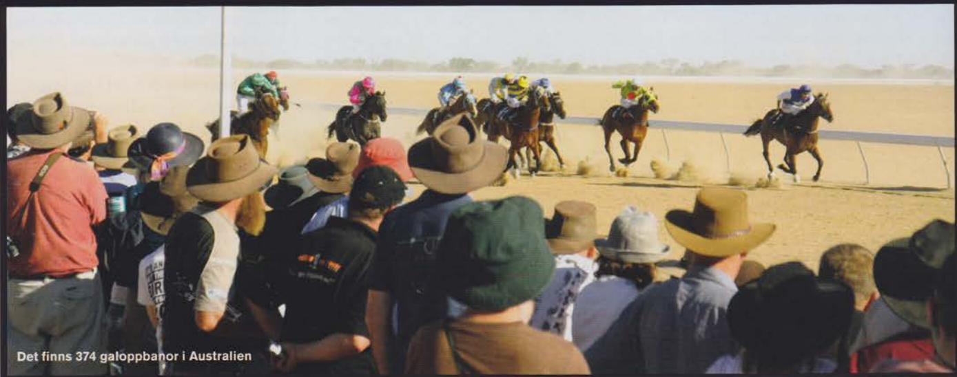
Det finns 374 galoppbanor i Australien