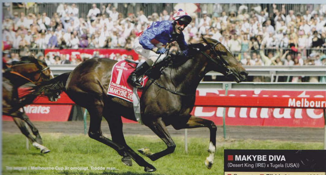
En segrar i Melbourne Cup är omöjligt. Trodde man...