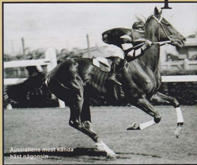
Australiens mest kända häst någonsin