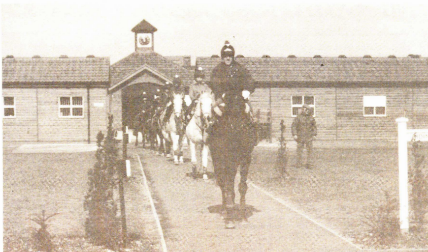
Elever i British Racing School rider ut på dagens första tur. I täten en av lärarna.

Den andra hälften av ansökningarna kommer från ungdomar som skriver själva. Det är lättare att få arbete i ett träningsstall efter att ha utexaminerat från kursen.