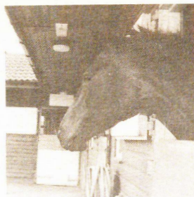
ENGULF - en gång två bakom Shergar, lever nu en halvpenzionerad tillvaro som "utbildare" för unga blivande jockeys. (Foto: Helena Mansén).

—Däremot har vi inga restriktioner när det gäller maten. När man är ung växer man och måste äta or-