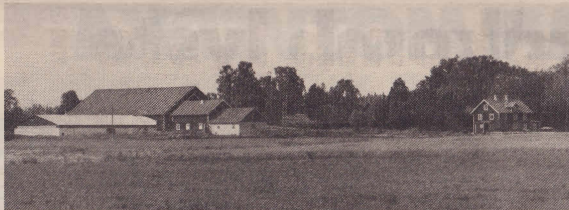
RÄVDANSENS STUTERI är sedan ett halvår beläget på nyinköpta Lindarsnäs Gård med 228 ha i Södermanland.

Seriösa försök att köpa in högklassiga avelshingstar och ston med moderlivsimporter så långt den svenska "uppfödarekonomin" tillåter, har noterats. Bara det senaste året har det skett en markant ökning av registrerade fullblodsföl och många nya uppfödare har tillkommit. Ett stort intresse finns och inte minst de kritiska rösterna är tecken